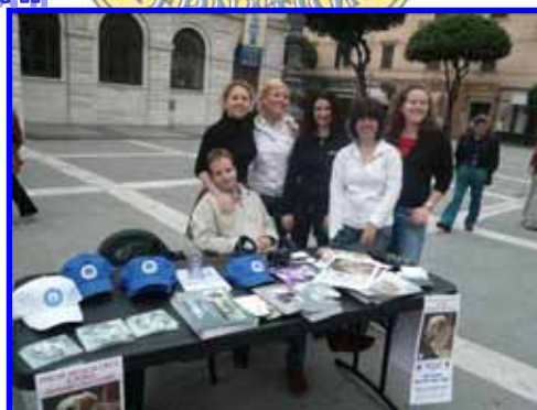
I Cani Guida