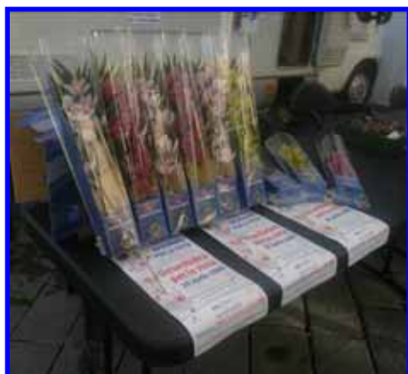
Orchidee per Sight First II