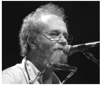
Il cantautore Francesco De Gregori

ALLE 21,30 IL «PRINCIPE» DELLA CANZONE D'AUTORE ITALIANA PRESENTA BRANI DEL NUOVO DISCO «PEZZI» E VECCHI SUCCESSI