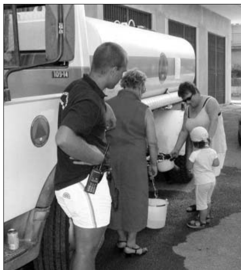
A Ceriale rifornimento d'acqua con le autobotti della Protezione civile