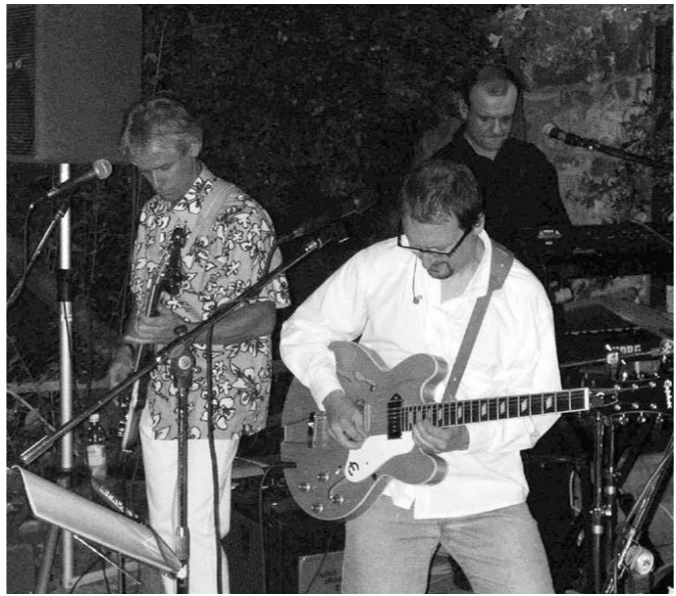
Sottosuono si esibiranno stasera nel campetto di Poggi, frazione di Imperia