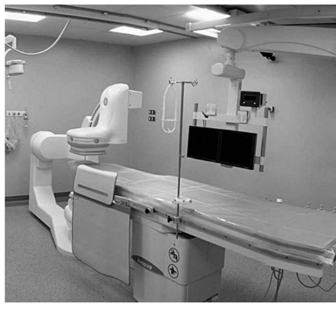
Il reparto di Cardiologia del Santa Corona

gio. In base ad alcuni testimoni l'incidente, che non è stato rilevato, sarebbe stato provocato da un'improvvisa sbandata, forse un colpo di sonno. S.A. avrebbe perso il controllo della moto su cui viaggiava finendo pesantemente sull'asfalto. Nell'urto ha riportato un trauma cranico e facciale. I medici si sono riservati la prognosi. Dopo un iniziale stato di coma le sue condizioni sono, nel pomeriggio di ieri, migliorate. Il giovane era reduce da una festa gastronomica con alcuni amici. [a. r.]